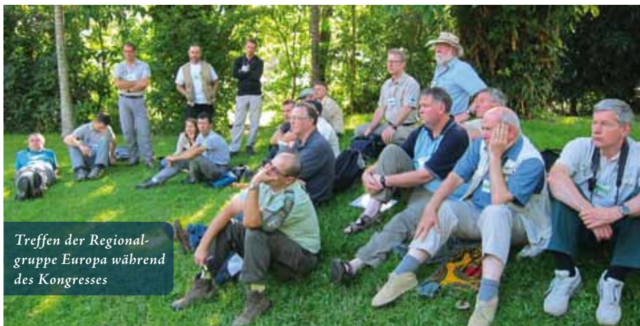
Treffen der Regionalgruppe Europa während des Kongresses

Nachdem wir der Bärengruppe diese Organisation vorgestellt hatten, wurde ein Arbeitsplan erstellt und unser Ziel festgelegt. Unser Ziel war, zum Ökomarkt in Bad Harzburg mindestens eine Schautafel zu entwickeln um die TTGLF bekannter zu machen und Spendengelder zu sammeln. Während der Sammelaktion sollte jeder Besucher des Ökomarkts auch sehen was er gespendet hatte und so war die Idee geboren durch die Harzburger Fußgängerzone eine dünne, grüne Linie zu ziehen. Für 1 € gab es 1 Meter dieser Linie. Unser Arbeitsplan sah vor, mit verschiedenen Institutionen in Kontakt zu treten, so zum Beispiel mit dem Bürgermeister von Bad Harzburg, dem Stadtmarketing und natürlich mit Sean Willmore selbst. Eine kleine Generalprobe wurde dann am 31. Juli 2012 durchgeführt. An diesem Datum findet der jährlich wiederkehrende Welt - Ranger Tag statt. Man gedenkt den Rangern, die in Ausübung ihres Berufs verstorben oder schwer verletzt wurden. Dadurch bedingt, dass zu dieser Zeit schon Sommerferien waren, fiel das Ergebnis hier in Bad Harzburg mit 28,50 € überschaubar aus. Die Rangerkollegen aus Torfhaus waren dafür aber sehr erfolgreich und konnten 105 € einsammeln. Der Ökomarkttermin rückte näher und näher. Wir verliehen unserer Stelltafel noch ein wenig