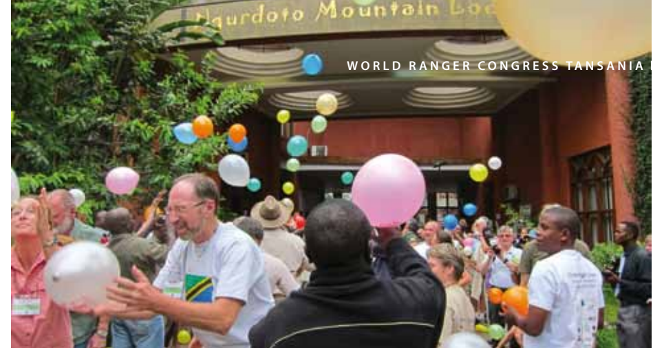
Übung zur Teambuilding

Stunde reduziert werden können, schaffen gute Beobachtungsmöglichkeiten aus der Luft. Wie die bisherigen Erfahrungen zeigen, fühlen sich Wildtiere von diesem Flugzeug, das mit einem besonders leisen Motor ausgestattet ist, nur wenig gestört. Die Anschaffungskosten liegen bei lediglich 45.000 Dollar. Elefanten sind wegen des internationalen Handels mit Elfenbein besonders durch Wilderei bedroht. In manchen Gebieten konnte der Rückgang jedoch gestoppt werden. Ausschlaggebend dafür waren Verbot des Elfenbeinhandels, erfolgreiche Projekte zum Schutz sowie verbesserte Ausbildung und Ausrüstung der Ranger. In Kenia sind die Elefantenbestände von 167.000 Tieren im Jahr 1973 auf 20.000 im Jahr 1990 abgesunken. Bis 2010 sind sie wieder auf 35.000 Tiere angewachsen. Leider ist die Wilderei auch lebensbedrohlich für Ranger. In Tansania sind nach Angaben des Ministeriums für natürliche Ressourcen zwischen 1997 und 2012 mehr als 16 Ranger durch Wilderer getötet worden. Wilderer leben in armen Gemeinschaften im Umfeld der Schutzgebiete und ihre Antriebskräfte sind Armut und Hunger. Lösungen können in der vermehrten Beteiligung der betreffenden Gemeinschaften am Nutzen der Schutzgebiete liegen. Hoffnungsvolle Ansätze bieten Projekte, bei denen die traditionelle Jagd