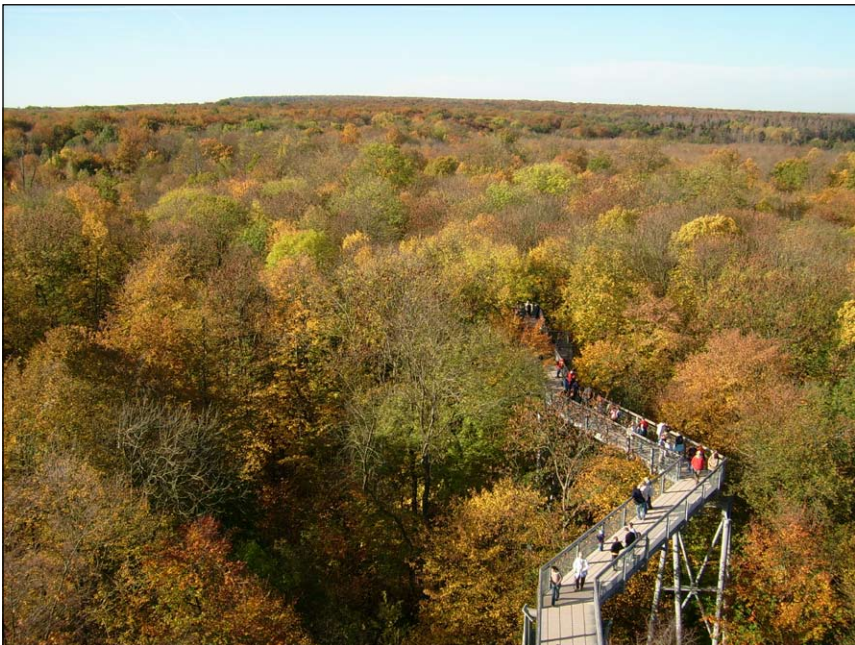
Baumkronenpfad im Nationalpark Hainich