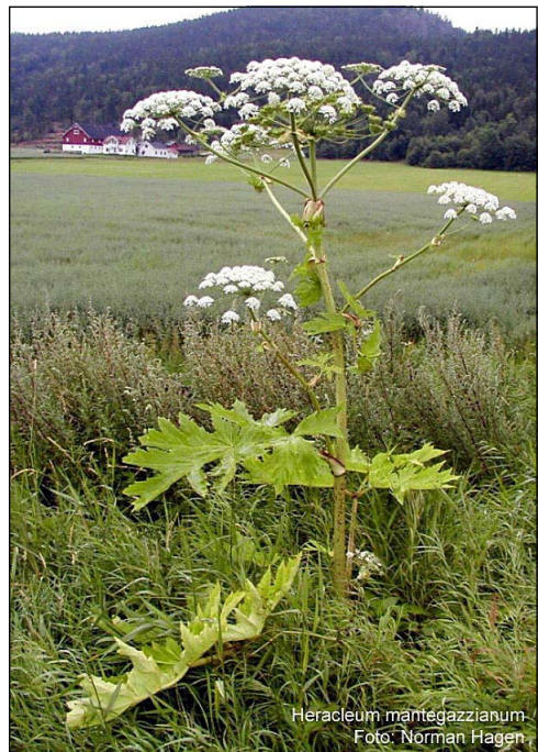
Heracleum mantegazzianum

Durch dieses Erlebnis sensibilisiert begann ich, mich etwas näher mit dem Riesen-Bärenklau zu beschäftigen, erst einmal etwas ungläubig ob seiner allgemeinen Gefährlichkeit. Ich stellte rasch fest, dass diese imposante Pflanze auch im Saarland, sogar bei uns in Primstal entlang von Wegrändern, wenn auch vereinzelt, vorkam. Meine Warnungen und Aufrufe an unsere Gemeinde zur Entfernung verhallten ungehört mit dem Ausspruch, das sei doch gar nicht so schlimm. So nahm die Zeit seinen Lauf und ich entfernte amateurhaft immer mal wieder und nicht nachhaltig selbst einige Einzelexemplare mit einem langen Stock oder Ähnlichem.