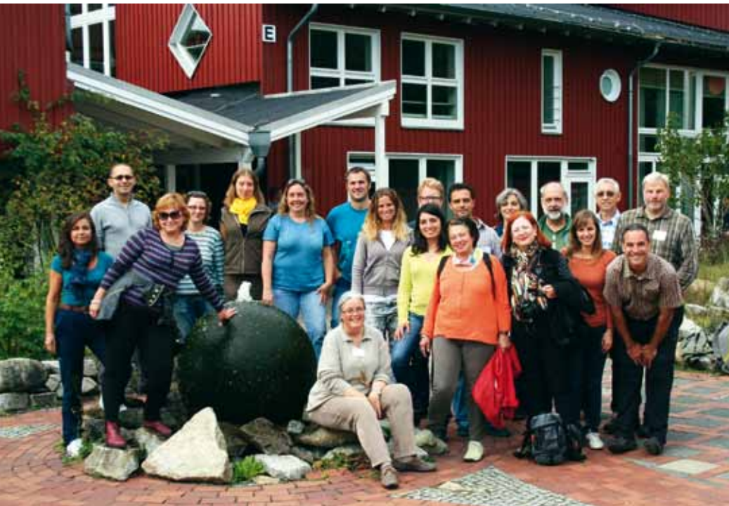
Die Kursteilnehmer am Internationalen Haus Sonnenberg im Harz