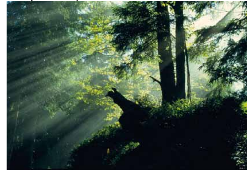
Stimmungsvoll am Feldberg