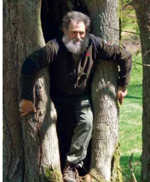
Ranger sind überall