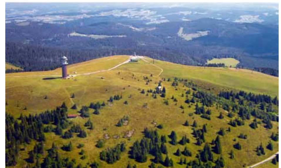
Seebuck im August 2005

Nächstes Kapitel: Wie gelingt es uns, unseren Gästen die notwendigen Schutzbestimmungen zu vermitteln? Ich finde es wichtig, dass sich Besucher in einer Landschaft zunächst wohl fühlen. Dies gelingt nur, wenn sie nicht auf Schritt und Tritt mit einer riesigen Latte von Einschränkungen und Verboten konfrontiert werden. Dort jedoch, wo Probleme